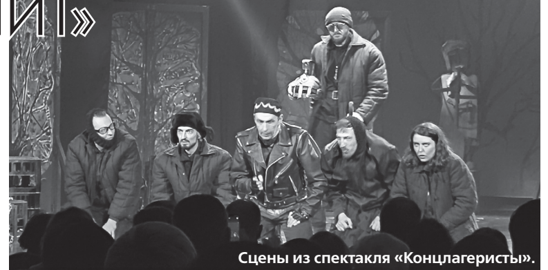
Сцены из спектакля «Концлагеристы».